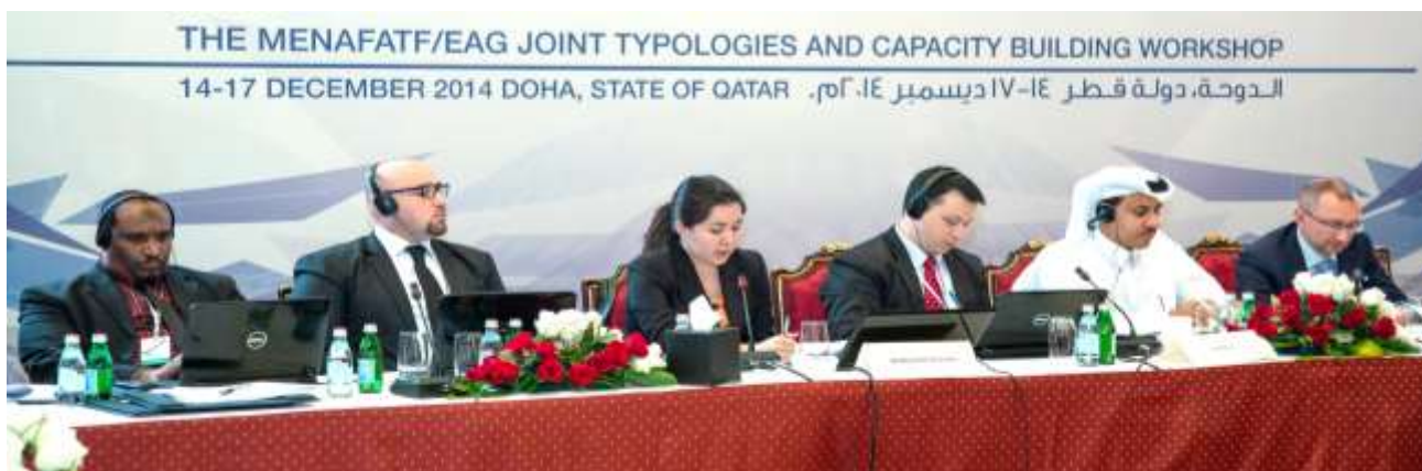
Совместный семинар ЕАГ/МЕНАФАТФ по Типологиям и укреплению потенциала

Бюро Координатора экономической и экологической деятельности ОБСЕ, Управлением ООН по наркотикам и преступности (УНП ООН) и Евразийская группа в